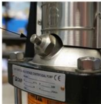
Рис.8 Пробка воздухосборника.